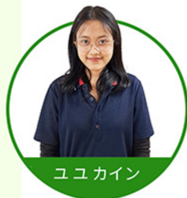
ユ ユ カ イン