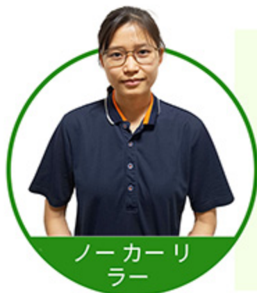
ノー カーリ ラー