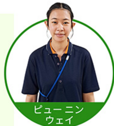
ピューニン ウェイ