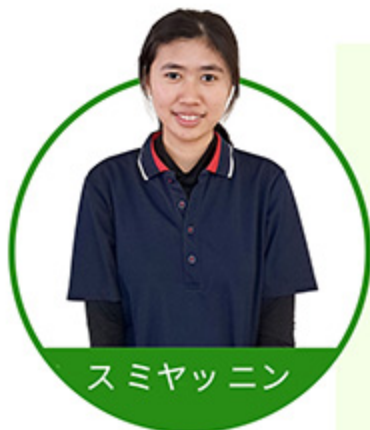
ス ミヤ ニン